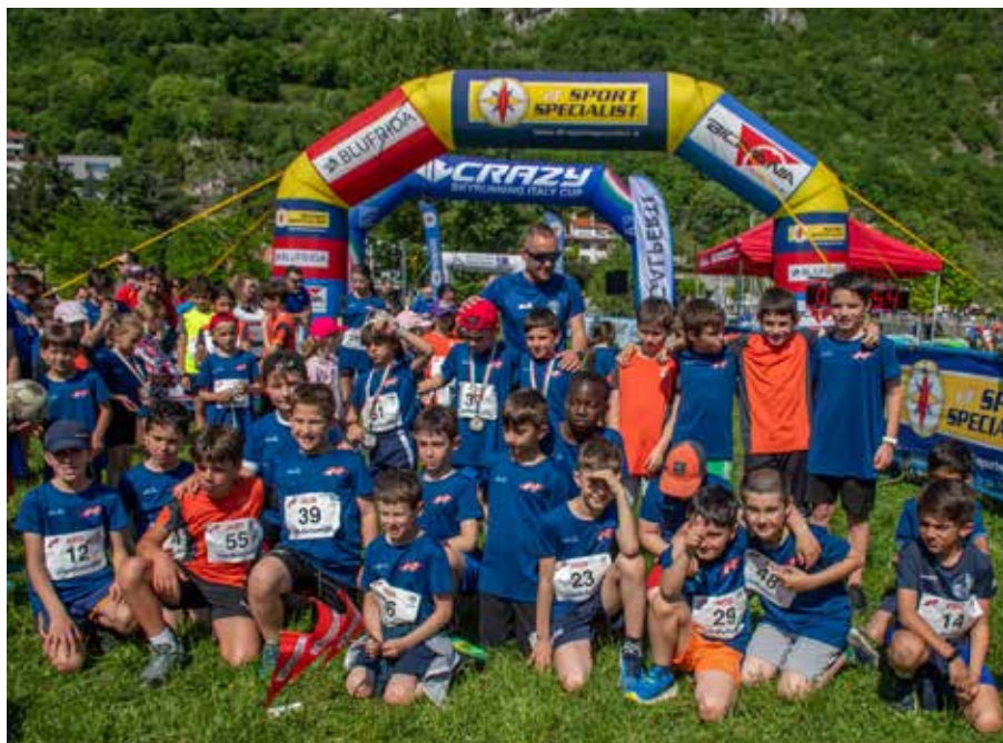
Fotoclub G. Anghileri, Valmadrera