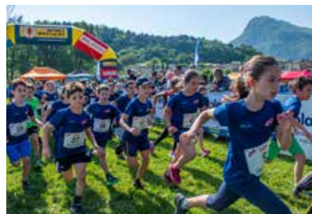
Fotoclub G. Anghileri, Valmadrera