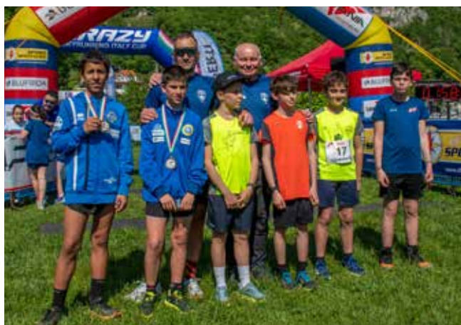
Fotoclub G. Anghileri, Valmadrera