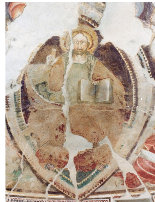
La Majestas Domini (sec. XV) nel catino absidale di Santa Margherita

La leggenda vuole che la fanciulla fosse originaria di Antiochia, figlia di un certo Edesimo, prete pagano. Orfana di madre, fu affidata ad una nutrice cristiana che viveva in campagna e che la convertì al cristianesimo. All'età di quindici anni (si era all'epoca delle persecuzioni di Diocleziano e Massimiano), mentre un giorno, assieme ad altre fanciulle accudiva al gregge di pecore della sua nutrice, Margherita fu vista da Olibrio, governatore della provincia, che viaggiava verso Antiochia. Questi, folgorato dalla bellezza della giovinetta, volle prenderla in moglie, convertendola alla fede pagana. Nonostante le più allettanti promesse, seguite da terribili minacce, la fanciulla rifiutò, non volendo abiurare alla propria fede. Olibrio la fece quindi sottoporre a feroci torture, la fece gettare in una oscura prigione ove le comparve il demonio in sembianze mostruose; Margherita se ne liberò con un gesto di croce. Vinto il demonio, la martire fu nuovamente tentata all'abiura dal governatore ma, essendosi rifiutata, fu sottoposta a nuovi tormenti. Da questi supplizi Margherita uscì indenne, grazie anche alla presenza dello Spirito Santo che la fanciulla aveva invocato onde fortificarla. Molti pagani che assistevano a tale prodigio credettero nel messaggio cristiano e si convertirono sì che, a punizione della loro abiura, furono fatti immediatamente giustiziare. Alla fine, anche la santa fu decapitata.